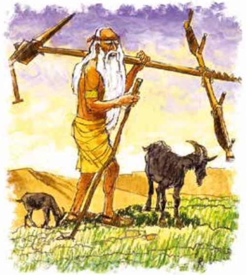
Methusalach leefde het langst van alle mensen.

Methusalach is de oudste mens die ooit heeft geleefd.